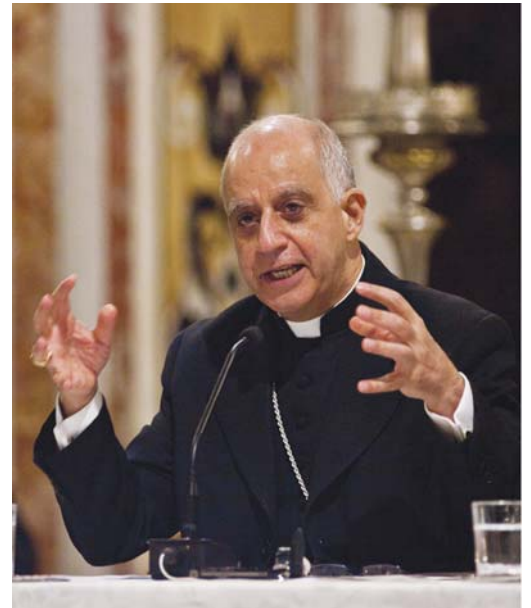
S. E. Mons. Rino Fisichella

dell'immagine della Genesi del giardino dell'Eden e dell'albero della conoscenza del bene e del male, "posto al centro del giardino". L'uomo vi fu condotto da Dio a segno della centralità di Adamo nella creazione, ma anche come monito alla sua incapacità ad attingervi da solo la conoscenza del bene e del male. La conoscenza che ne derivò sarà sotto il segno di una caduta, cui solo il sacrificio di Cristo ha determinato "la sovrabbondanza della Grazia dove abbondò il peccato", secondo la lettera ai Romani, ripresa dal presule. La naturale fragilità dell'uomo, che, per Pascal, "anche una bolla di vapore può uccidere", la cui consapevolezza tuttavia lo rende "di poco inferiore agli angeli", segnata da quella nostalgia di Dio, impressa, come ha ricordato il conferenziere con le parole della liturgia del Venerdì Santo, nel cuore di tutti gli uomini. La nostalgia, etimologicamente, è "dolore per il ritorno", nel senso di un'attuale mancanza. Il ritorno all'identità cristiana dell'Europa è la sfida della nuova evangelizzazione come concepita da Benedetto XVI.