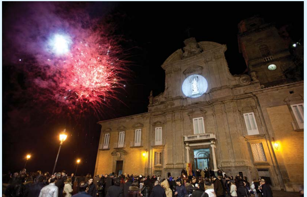
La notte tra il 31 dicembre ed il 1° gennaio splende di luci e di fuochi d'artificio che festeggiano l'ingresso dell'anno del Millennio