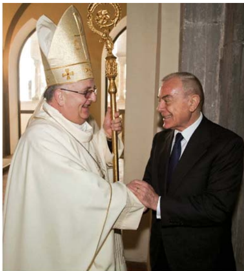
L'incontro cordiale tra S. E. Mons. Moretti e il Sottosegretario Gianni Letta prima della Messa solenne

Nello stesso tempo tutto questo ci responsabilizza per diventare protagonisti insieme al disegno provvidenziale di Dio a costruire la storia, perché possa essere caratterizzante come storia di salvezza, come una storia che si mette la radice di ciò che caratterizza Dio stesso che è l'amore. E nella misura in cui ci facciamo discepoli del Signore possiamo e dobbiamo diventare costruttori di amore, che significa essere operatori di giustizia, operatori di pace,