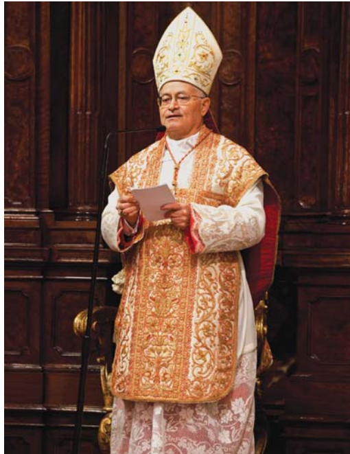
Il Card. Salvatore De Giorgi pronuncia l'omelia

Ne sono splendidi documenti la lunga serie di Abati riconosciuti dalla Chiesa come santi e beati; il prezioso contributo dato alla riforma della Chiesa soprattutto nel secolo XI; l'attenzione e la fiducia di cui è stata oggetto: da parte di Sommi Pontefici, che concessero insigni privilegi; da parte di vescovi, che chiedevano la presenza dei monaci cavensi nelle loro diocesi; da parte di principi secolari, che la dotarono di possedimenti a beneficio delle popolazioni soprattutto povere, le quali trovavano nel Monastero aiuto, protezione e promozione sociale, e a servizio della cultura (basti pensare alla Biblioteca e all'Archivio), come