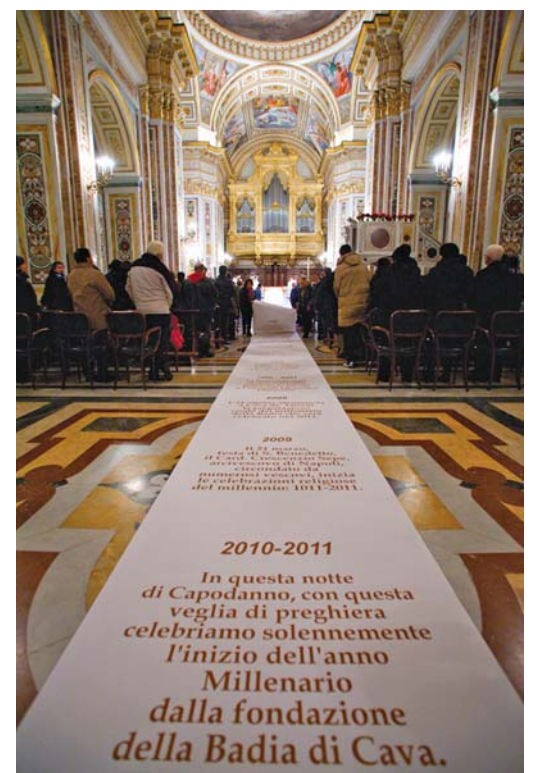
Il rotolo degli eventi più notevoli del Millennio appena compiuto è stato svolto dall'altare maggiore fino alla porta della Cattedrale.

2010-2011 - In questa notte di Capodanno, con questa veglia di preghiera celebriamo solennemente l'inizio dell'anno Millenario dalla fondazione della Badia di Cava.